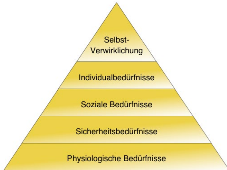
Abbildung: Maslow'sche Bedürfnispyramide